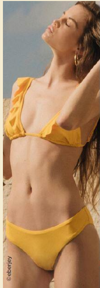
THE ESSENTIALS & COCOONING